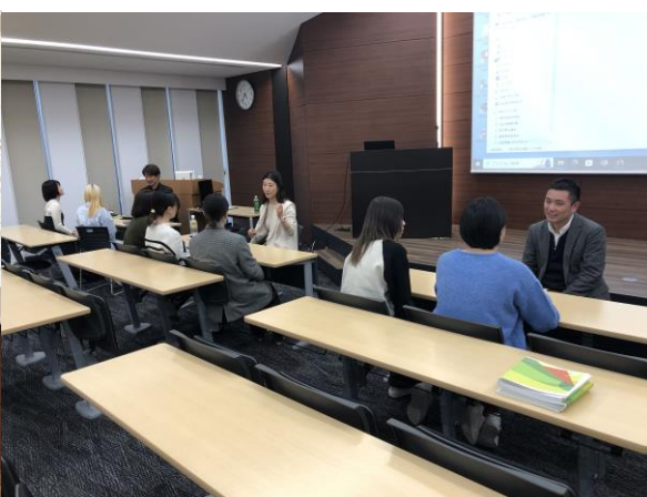
スクランブル質問タイム