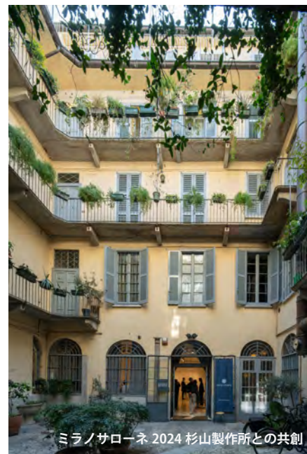
ミラノサローネ 2024 杉山製作所との共創

SOL style 代表。「FUN & FUNCTION」をキーワードに、インテリアに始まり、世界各国のパビリオンのクリエイティブディレクションから会場デザイン、プロダクトまで、多岐にわたりデザインする。