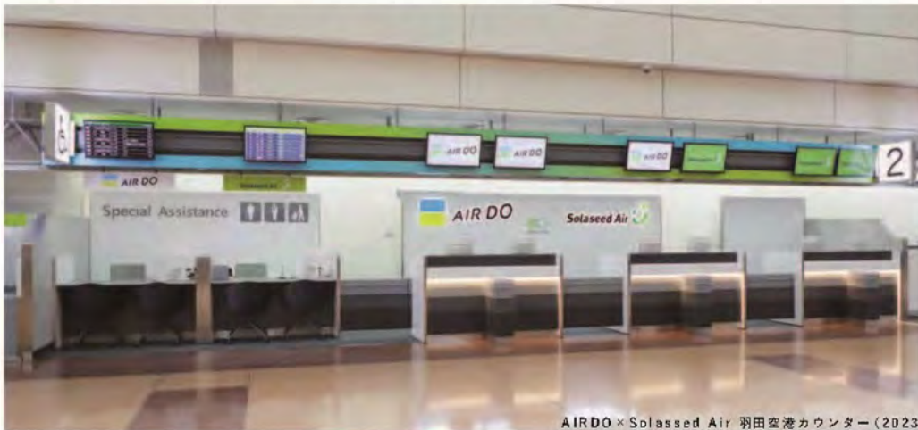
AIRDO × Solaseed Air 羽田空港カウンター (2023)