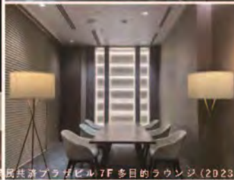
市民共済プラザビル7F 多目的ラウンジ (2023)