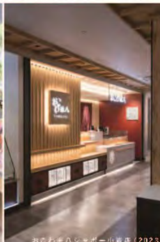
おこわ米八シャポー小岩店 (2023)