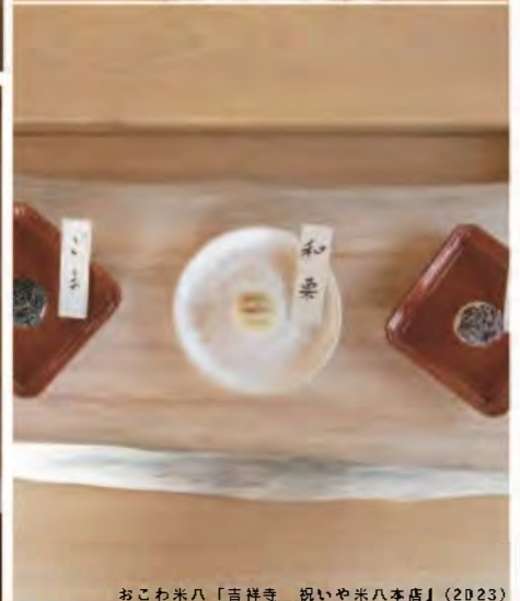
おこわ米八「吉祥寺 祝い米八本店」(2023)