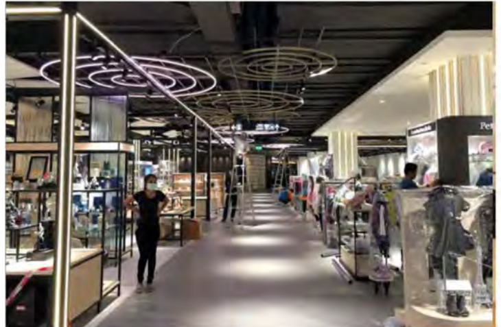
サイアム高島屋（タイ/バンコク）