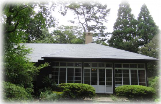
ヴォーリズ六甲山荘