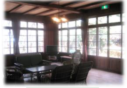
六甲山荘のリビング