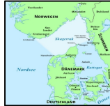
バレンツ海(北極海) ルウエー海(大西洋) スカゲラ海峡(スウェーデン・デンマーク)

The Pollution Control Act strictly regulates all industries and is complemented by control mechanisms. Discharges of hazardous chemicals from land-based point sources have been reduced, but there are still inputs of pollutants to the sea. Since we both harvest and produce food in the ocean, food safety is of the utmost importance and monitoring routines are in place. Marine litter and micro-plastics are of increasing concern. Norway has taken an initiative in the UN Environment Assembly to step up global action to combat marine litter and micro-plastics. Fishing vessels have an obligation to retrieve or report lost fishing gear, and each year the Directorate of Fisheries conducts a retrieval survey. A pilot project called 'Fishing for litter' has been launched.