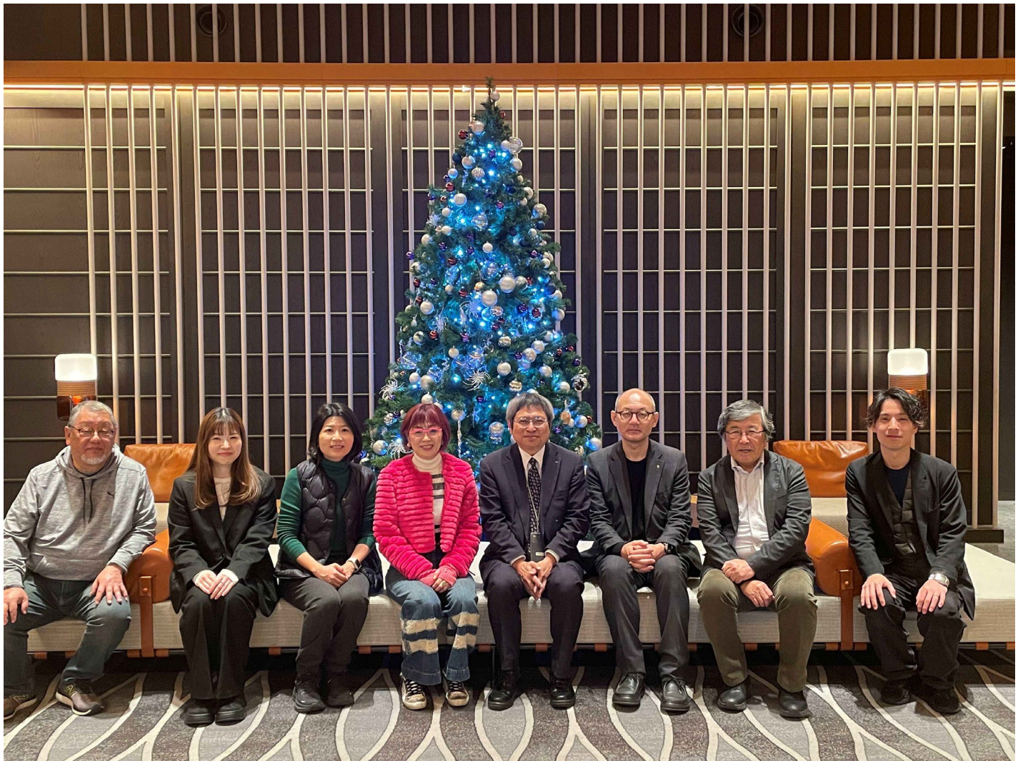
ヒルトン京都 ロビーにて